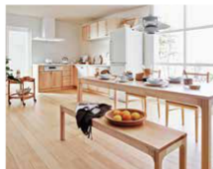
掲載の写真・イラストは全てイメージです。